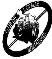
COM 50140 MORTAIN